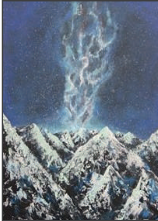
بريشة الطالبة: لمياء الغامدي