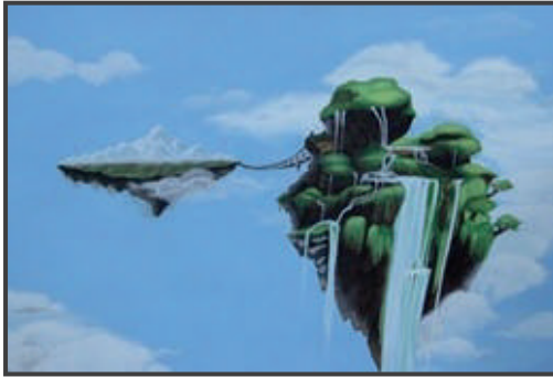
بريشة الطالبة: غادة عزيز